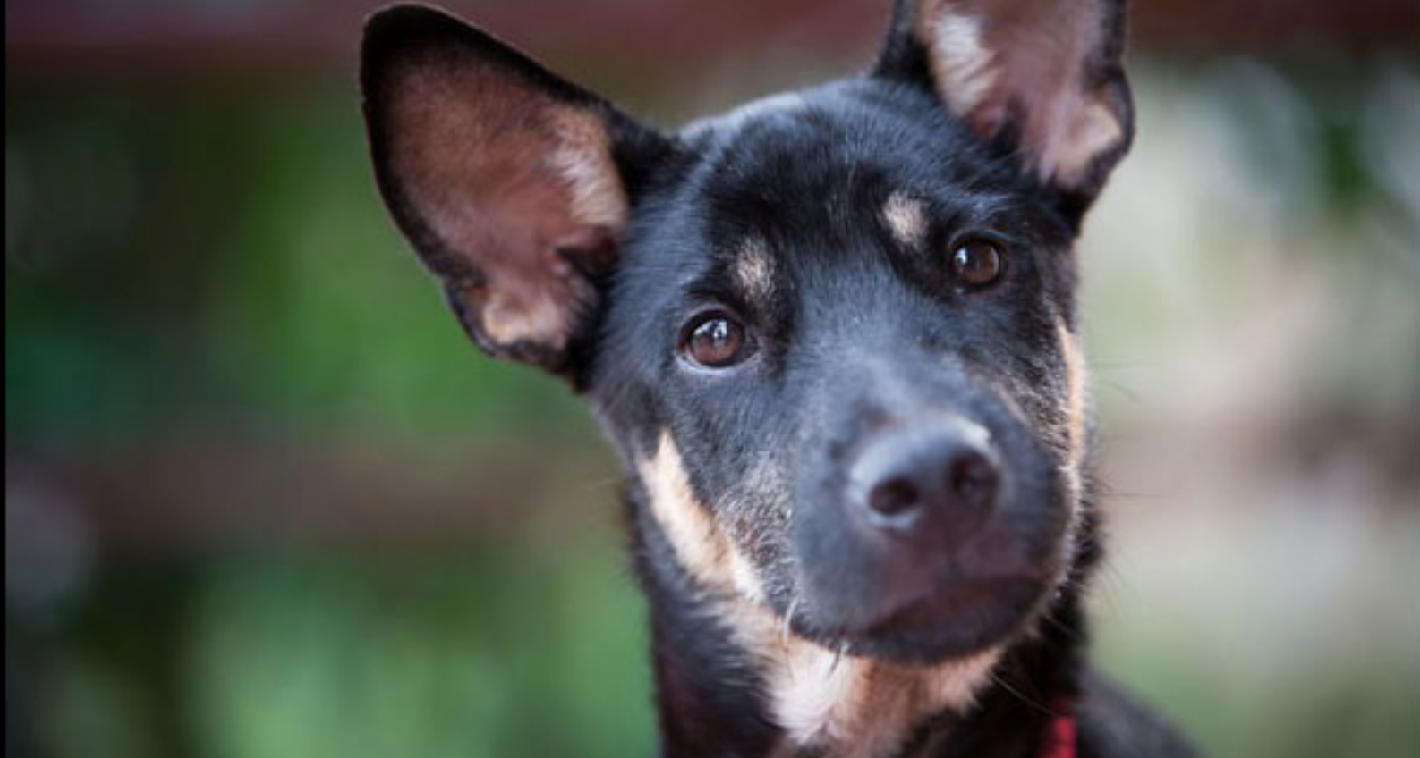
苏梅岛棕榈居度假村-度假村宾客的忠实好友Skye

查询及预订可发送邮件至 bookings@thepalms-retreat.com ，或登录网站： www.thepalms-retreat.com 。