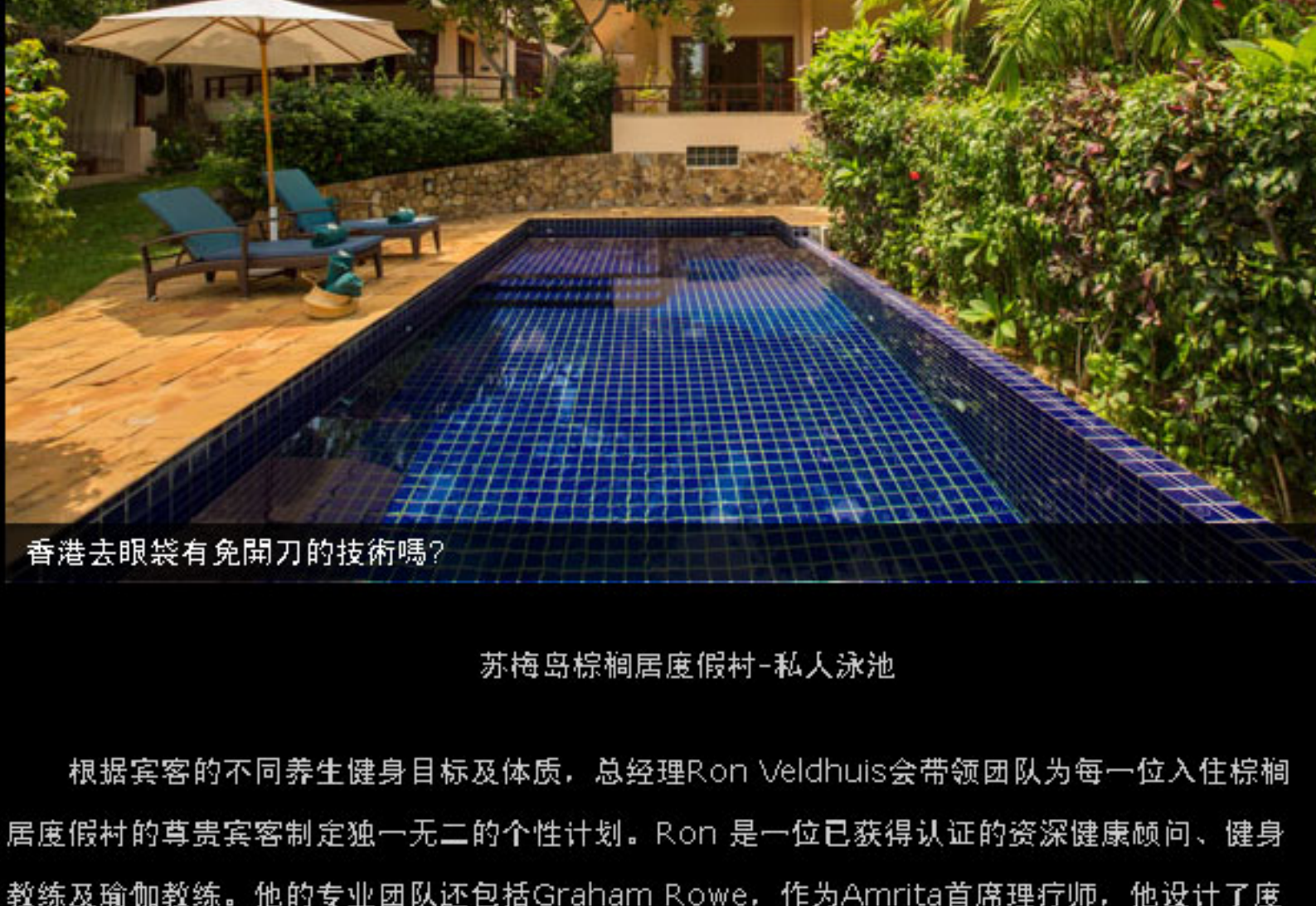
苏梅岛棕榈居度假村-私人泳池

日常的度假村入住费用包括宽敞的套房（有些套房设有室内外淋浴），包括两种独立的温和有效的排毒项目（二选一）即轻松健体和清爽排毒，各项瑜伽和冥想课程，每日60分钟放松按摩，清晨海滨漫步，以及“超越自我”巅峰项目。选择清爽健体项目的宾客可全天24小时享受度假村内完全有机、产于当地的美食及草药。