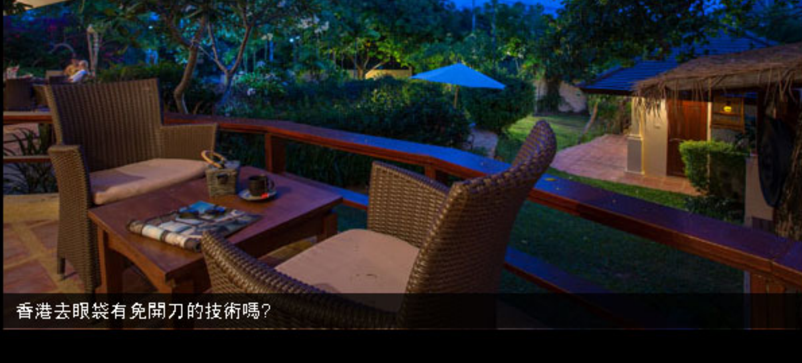
苏梅岛棕榈居度假村-客房阳台景观

此外，宾客还可参与的活动包括个性化健身房、皮艇运动、轻便潜水/浮潜、美容养生、个性化定制的冥想瑜伽课程等。