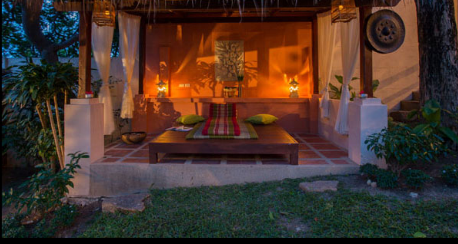
苏梅岛棕榈居度假村-别具特色的起居室

我们寻访到苏梅岛上最好的理疗师和养生专家，与最优秀和专业的人才合作，为宾客们打造无与伦比的个性化服务，提供当地特色体验，使用纯天然有机产品，营造静谧美丽的度假环境。我们坚信通过这些努力，棕榈居度假村可以为宾客提供独一无二的、以期改变人生的旅程体验。”