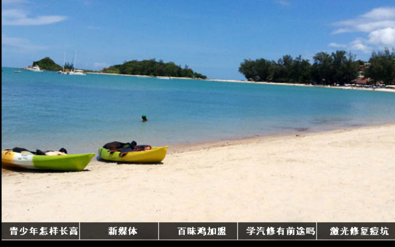
苏梅岛棕榈居度假村-白色柔软沙滩

棕榈居度假村推出的排毒养生项目按时间长短可有多个选择：三日排毒、七日排毒及十日排毒项目（甚至更长）。这些项目可有效地帮助宾客排毒养颜、减肥减脂，同时保证身体健康。棕榈居度假村独有的两项原创服务：轻松健体和清爽排毒，通过每日特调冰沙食谱（由100%纯天然的泰国药草和其他自然选料调制而成），以及综合瑜伽、冥想、身体运动、按摩和当地特色的泰国体验，达到强健身体、愉悦身心的目的。